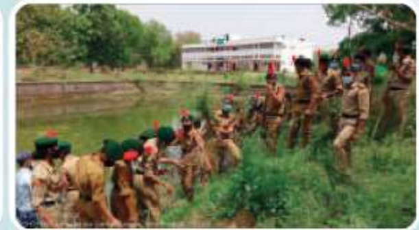
पुनीत सागर अभियान के अन्तर्गत ककरा घाट, प्रयागराज की सफाई करते हुए एन०सी०सी० कैडेट